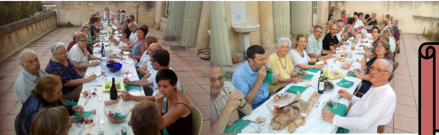
Repas des conseillers et membres de la chorale paroissiale sur la terrasse du presbytère le 30 juin

Suite au vœu du synode pour l'accueil des migrants, la paroisse d'Arles a organisé une exposition (du 4 au 10 juillet) des photographies NB d'Angelos Tzorzinis « In search of the European dream », sponsorisée par